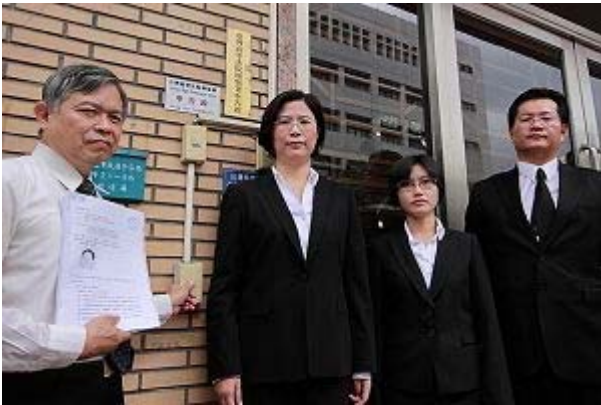
台湾法轮大法学会于二零一零年九月二十日下午两点，再次向台湾高等法院检察署按铃申告，提告湖北省副书记、武汉市委书记杨松违犯“残害人群罪”及“民权公约”规定

朱婉琪说：“我们希望台湾的检察机关，不要让世界等的太久，不要让台湾民众灰心，我们希望我们身后的高检署，能够在法轮功的案子上面，真正的起到一个司法正义的作用。”