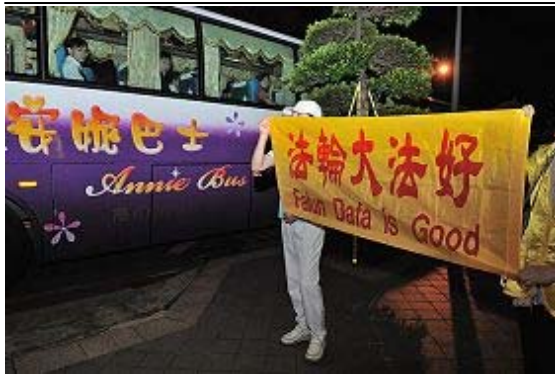
杨松秘密离开，法轮功学员在车外展开『法轮大法好』横幅。

（接上页）面，一位法轮功女学员，平和地向守候在外的现场人士讲述杨松在大陆犯下的灭绝信仰、虐杀罪行，讲述法轮功学员讲真相是为了救人。现场十多名刑警、警卫们默默聆听了一个多小时。女学员还向杨松的保镖们劝善：“踏着别人的眼泪前进，是会一辈子良心不安的，有机会的话，千万不要接这样的工作。”