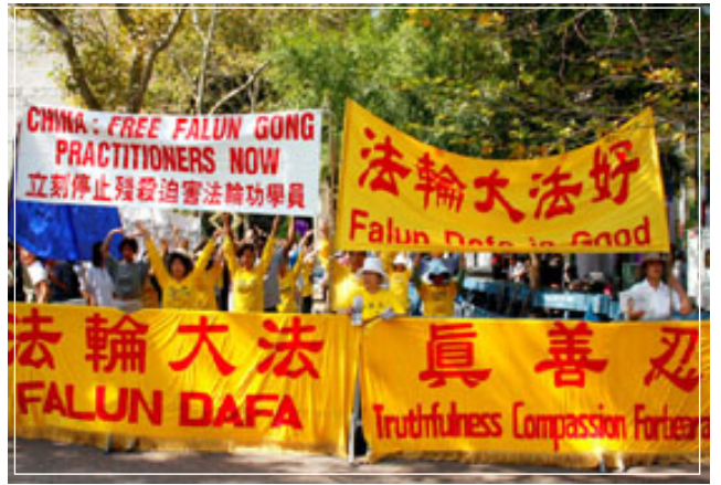
■ 法轮功学员联合国广场上谴责中共迫害

“我们来到这里, 是在呼唤众人的良知, 呼唤人类的善良, 希望更多善良的人能和我们一起, 早日结束这场灭绝人性的迫害。也希望随团而来的中国代表们能有机会好好了解了解法轮功, 审视审视自己的良心, 为自己做点好事。正义