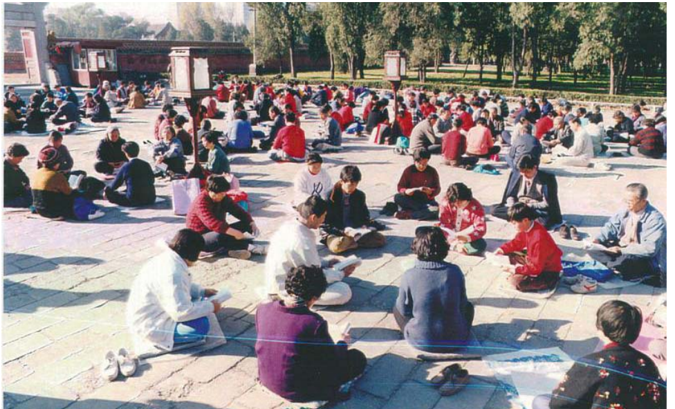
图：1999年北京法轮功学员们在天坛公园集体学习法轮功主要著作《转法轮》

这汴梁城里发生的使浪子回头的真实故事，让人更加了解法轮大法指点人们走上正路，对稳定社会、提高人们的道德水准，起到了不可估量的正面作用。（文/清心）。