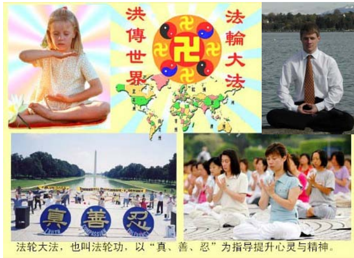
法轮大法，也叫法轮功，以“真、善、忍”为指导提升心灵与精神。