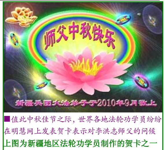
■值此中秋佳节之际，世界各地法轮功学员纷纷在明慧网上发表贺卡表示对李洪志师父的问候 上图为新疆地区法轮功学员制作的贺卡之一

当然，中共的欺骗是方方面面的。海外如实的报道法轮功的信息，它就造谣说这是“反华势力”所为。其实，中共是把一切反对它恶毒政策的力量统称为“反华势力”的。这样一来，还真有许多被中共洗脑的人，不知不觉地就把海外帮助国内民众而去指责中共恶行的力量以“反华势力”去看待了。明确地说，这些所谓的“反华势力”反的是中