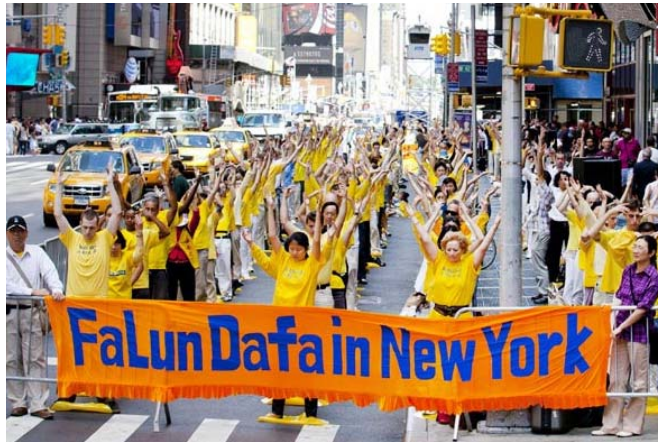
■ 法轮功学员在纽约时代广场集体炼功

（明慧记者纽约报道）美国纽约号称“世界之都”，这里几乎汇聚了世界上各个国家和民族的人群；而纽约的时代广场则堪称“世界之都”的心脏。每天这里不仅交通拥挤繁忙，同时吸引着成千上万的游客光顾。可以说这里是世界上最热闹繁华的街区。二零一零年九月三至五日，数千名来自世界各地的法轮功学员云集纽约，举办了为期三天的包括国际法会、大型炼功、集会和“呼唤良知 停止迫害”的游行等一系列活动。