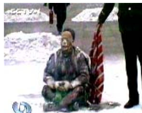
央视自焚伪案镜头