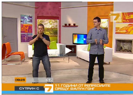
图：保加利亚西人法轮功学员（左）为主持人和观众演示功法

二零一零年七月二十日，在法轮功学员反迫害十一周年之际，保加利亚国家电视 7 台的早间节目特邀两位西人法轮功学员介绍法轮功。在现场直播的节目中，法轮功学员为主持人和观众示范了法轮功功法。在节目的最后，两位法轮功学员将象征希望的手工莲花作为礼物送给两位主持人，他们呼吁制止迫害法轮功。