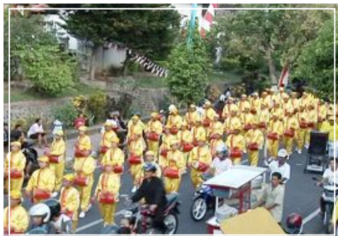
■具有中国民间特色的腰鼓队

别具一格的炼功队更是吸引着早就想了解法轮功的民众。伴随着炼功音乐，学员们展示着舒缓的炼功动作，好多民众跟着学员们的动作学做。◇