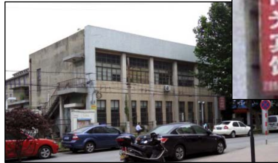
南光宾馆的北侧大楼

大约是 2006 年前后，南京市“六一零”把这个邪恶的市级洗脑班又搬迁到南京市秦淮区红花村旁的某废弃的兵工厂的招待所，名为“南光宾馆”（距 23 路、58 路终点站旁一百多米远）继续干着迫害法轮功、迫害信仰和人权、破坏宪法的罪恶勾当。◇