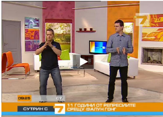
图：保加利亚西人法轮功学员（左）为主持人和观众演示功法

二零一零年七月二十日，在法轮功学员反迫害十一周年之际，保加利亚国家电视 7 台的早间节目特邀两位西人法轮功学员介绍法轮功。在现场直播的节目中，法轮功学员为主持人和观众示范了法轮功功法。在节目的最后，两位法轮功学员将象征希望的手工莲花作为礼物送给两位主持人，他们呼吁制止迫害法轮功。