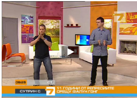
图: 保加利亚西人法轮功学员 (左) 为主持人和观众演示功法

二零一零年七月二十日, 在法轮功学员反迫害十一周年之际, 保加利亚国家电视 7 台的早间节目特邀两位西人法轮功学员介绍法轮功。在现场直播的节目中, 法轮功学员为主持人和观众示范了法轮功功法。在节目的最后, 两位法轮功学员将象征希望的手工莲花作为礼物送给两位主持人, 他们呼吁制止迫害法轮功。