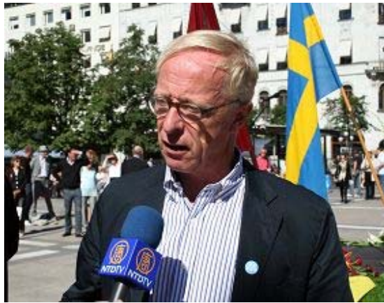
欧盟议员霍克马尔科在演讲后接受采访

【明慧网】二零一零年八月二十三日中午，瑞典“共产主义相关史料协会”在斯德哥尔摩市中心举办每年一度的国际纪念日活动，纪念在共产集权、纳粹以及其它极权主义下受迫害的人们。