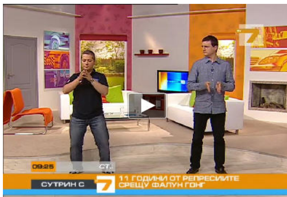
图：保加利亚西人法轮功学员（左）为主持人和观众演示功法

二零一零年七月二十日，在法轮功学员反迫害十一周年之际，保加利亚国家电视 7 台的早间节目特邀两位西人法轮功学员介绍法轮功。在现场直播的节目中，法轮功学员为主持人和观众示范了法轮功功法。在节目的最后，两位法轮功学员将象征希望的手工莲花作为礼物送给两位主持人，他们呼吁制止迫害法轮功。