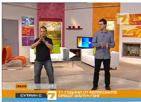
图：保加利亚西人法轮功学员（左）为主持人和观众演示功法

二零一零年七月二十日，在法轮功学员反迫害十一周年之际，保加利亚国家电视 7 台的早间节目特邀两位西人法轮功学员介绍法轮功。在现场直播的节目中，法轮功学员为主持人和观众示范了法轮功功法。在节目的最后，两位法轮功学员将象征希望的手工莲花作为礼物送给两位主持人，他们呼吁制止迫害法轮功。