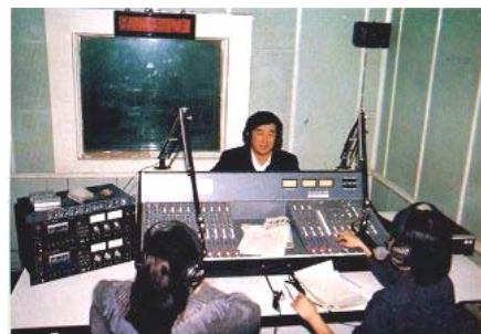
李洪志先生于一九九四年三月十八日在天津人民广播电台热线咨询