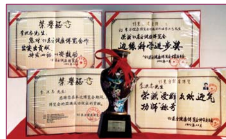
李洪志老师荣获 93 年健康博览会“边缘科学进步奖”和“受群众欢迎气功师”称号