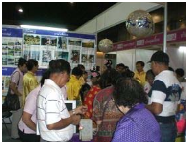
■ 观众在法轮功学员的展位了解功法和真相