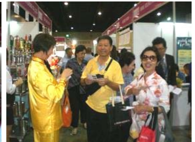
■ 参观者得到法轮功真相资料，非常高兴