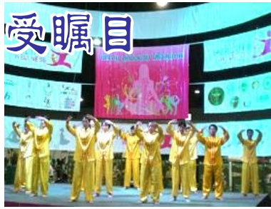
■ 法轮功学员在泰国健康博览会上演示功法

表演结束后，法轮功学员的展位成了观众的热点，许多人前来询问讯息，取阅资料，购买大法书籍。一位泰国石油公司环保负责人表示，以后组织单位的福利活动时将向职员介绍法轮功，并请法轮