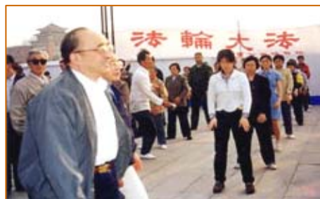
国家体育总局局长伍绍祖赴法轮大法发祥地长春考察（98 年 5 月 15 日）