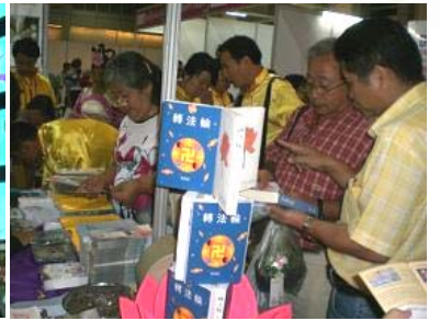
■ 观众在法轮功学员的展位了解功法和真相