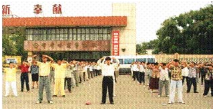
图：九九年以前，齐齐哈尔市法轮功学员在祥和宁静地炼功。

李老师当年在齐市传法时，曾打出很多法轮寻找有缘人，讲法班还未开班，一名学员就感到法轮在身体上旋转，当聆听李老师讲法时才恍然明白。李老师还亲自为齐市建立辅导站、炼功点。讲法班结束时，李老师不让学员们去火车站送行，学员们只好在电业文化宫门外的必经之路等待师父走过，和师父告别，大家都眼含泪水怀着依依惜别的心情，目送师父一行人渐渐消失在茫茫夜色中。（文／黑龙江大法弟子）