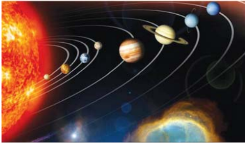
精美的太阳系是偶然形成的吗？

牛顿是近代科学家中最杰出的代表人物，牛顿在从事科学研究之前就已经信神，在信仰的殿堂中，他向世人证明了高级生命所