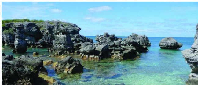
图：百慕大因频繁发生飞机船只失踪事件而闻名