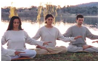
图：法轮大法使亿万人身心健康，已弘传世界一百多个国家，吸引了各族裔的人修炼。

自从真念定下想学炼法轮功之后，思想上身体上发生了天翻地覆的变化，酒也不喝了，麻将也不打了，脏话也少说了，身体似病的症状（修炼前，我曾患有偏头疼、肠炎、肾结石、小叶增生、颈椎病、关节炎、手