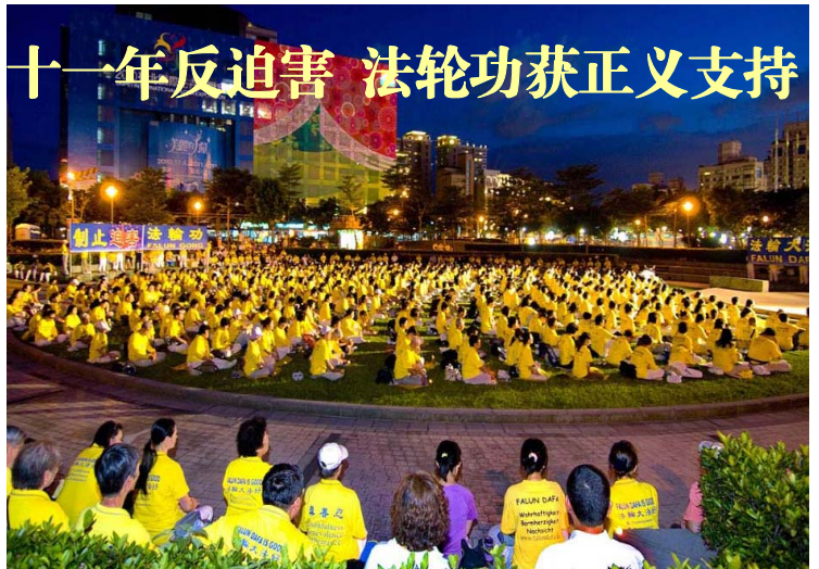
图：二零一零年七月十八日，台湾北区上千名法轮功学员在台北信义广场举办“彰显正义良知、制止中共血腥迫害”的活动。

地写到：“我的心与他们（法轮功学员）及他们的家属同在。我认为骚扰、逮捕或迫害他们绝对是犯罪。”