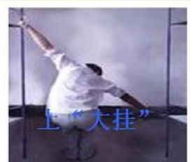
演示：中共劳教所酷刑种种