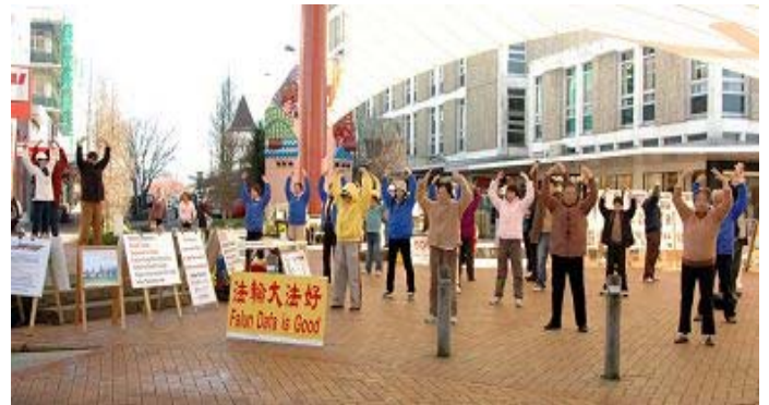
图:新西兰法轮功学员于罗托鲁阿(Rotorua)市中心的City Focus广场集体炼功

二零零八年九月,罗托鲁阿市小学(Rotorua Primary School)邀请法轮功