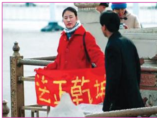
图：美联社图片：一名女法轮功学员在天安门广场和平请愿

很多中国人搞不懂这些修炼者他们为了什么呢？为了出名？中共的谎言已经让他们名誉扫地，一旦被抓捕，更是尊严尽失；为了私利？只要讲真相就面临着被停职、被罚款、被抄家，很多修炼者已经一贫如洗甚至负债累累。他们冒着重重危险，他们节衣缩食，他们顶风冒雪，他们为了什么呢？如果为了自己，他们可以选择富贵、选择安逸，选择远离牢狱和酷刑，但是为了让人们了解真相，为了民众不在被欺骗中造下诋毁佛法的罪业，他们默默地牺牲了自己，把大法的真相传到了万千人的心中。