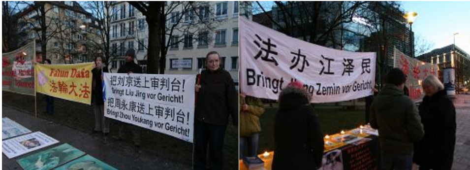
图：法轮功学员抗议中共迫害，呼吁巴伐利亚州和德国政府正视中国人权

（明慧记者德祥德国报道）中国副总理李克强于二零一一年一月七日至八日访问了德国柏林和慕尼黑。柏林法轮功学员在柏林中国使馆前抗议中共对法轮功长达十一年的残酷迫害。慕尼黑及周边城市奥格斯堡、纽伦堡、英格尔斯塔特及安森巴赫等地的法轮功学员，聚集在巴伐利亚州政府对面，抗议中共迫害，并呼吁巴伐利亚州政府及德国政府在和