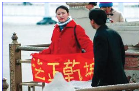
图：一名女法轮功学员在天安门广场和平请愿