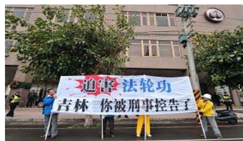
台中福华饭店外，法轮功学员打出横幅“迫害法轮功，吉林你被刑事控告了”

北京市副市长吉林迫害法轮功非常严重，现在在全世界很多国家都有人来控诉他，群体灭绝罪，他是（迫害）人权的共犯。