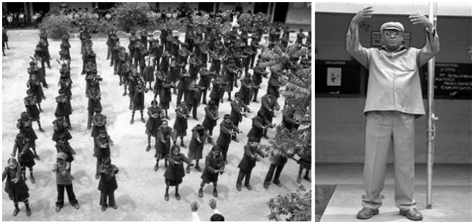
VERKEY 校长带领全校师生集体炼功

为什么中共强迫人们从小加入它的组织，并发毒誓把生命和一生都献给它？其真实目的就是害人、毁人。因为人们一旦加入中共的组织，成为它的一员，那么它所做的一切恶事就要算你一份。在中共罪大恶极，上天要惩罚它时，如果没有声明退