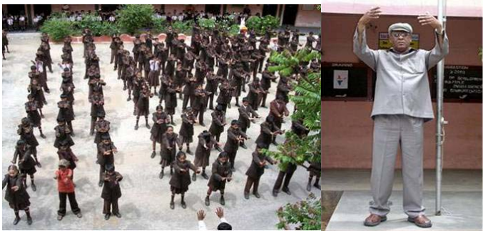
VERKEY 校长带领全校师生集体炼功

为什么中共强迫人们从小加入它的组织，并发毒誓把生命和一生都献给它？其真实目的就是害人、毁人。因为人们一旦加入中共的组织，成为它的一员，那么它所做的一切恶事就要算你一份。在中共罪大恶极，上天要惩罚它时，如果没有声明退出中共组织，就可能会成为它的牺牲品。而上天有