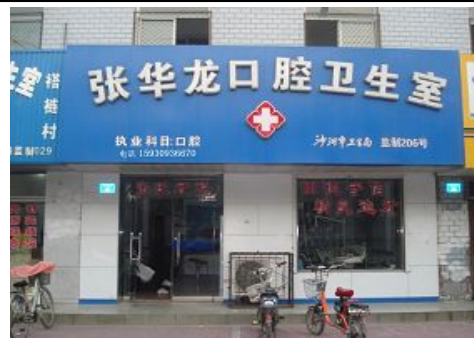
沙河市建设路 41 号张广才工作的诊所 (以其儿子的名字命名)

张广才绝食抗议迫害,又遭到洗脑班副“校长”邱有林的暴力灌食。短短几天时间,张广才被折磨的呼