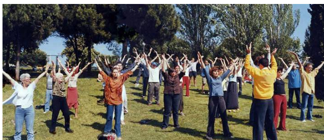
左图：在西班牙全国健康博览会上，一批又一批的参观者在室外学习法轮功。

在西班牙连续三年（2001—2003）的全国健康博览会上，法轮功都成为最受瞩目的明星。博览会主办者说：“法轮大法快成了博览会的专场展示会了。法轮大法是唯一享有可以在室外展示这一特权的参展者。”博览会期间，西班牙国家电台、巴塞罗那电