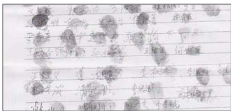
图：村民们的部分签名

【明慧网】美国首都华盛顿纪念碑前的气氛庄严、肃穆，来自世界各地的一千多名法轮功学员排出“Falun Dafa”以及烛光方阵，悼念被中共迫害致死的中国大陆法轮功学员。◇