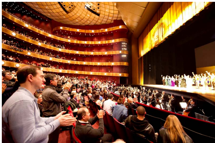
图：2011 年 1 月 16 日下午，神韵纽约艺术团在美国林肯中心大卫寇克剧院的第十场演出落幕。