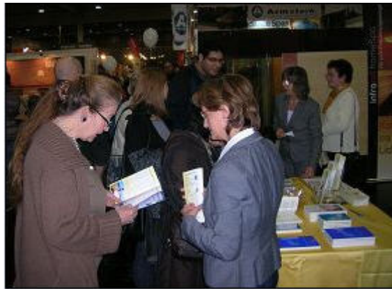
人们在法轮功学员的展位前详细了解功法

在法轮功学员的展位上,有法轮大法书籍和炼功音乐光碟,提供给来访者阅读并购买。法轮功学员穿着黄色炼功服,进行功法演示。祥和的功法和悠扬的音