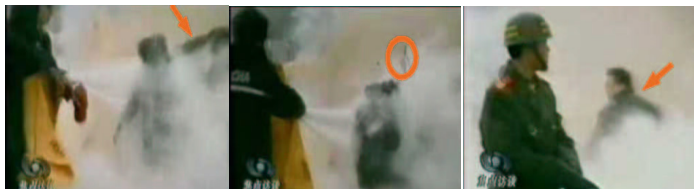
1.刘头部受重击 2.击打后飞出的重物 3.打击者仍保持用力姿势

CCTV《焦点访谈》提供的录像镜头放慢可以看见,被官方媒体称为自焚而死的刘春玲身上的火焰已经基本熄灭,突然,有人用物体猛击她的头部,刘春玲随即倒地,一条状物快速弹起,从死者脑后飞出,又以极快的速度从空中落下。一名身穿大衣的男子正好站在出手打击的方位,仍然保持着一秒钟前用力的姿势。