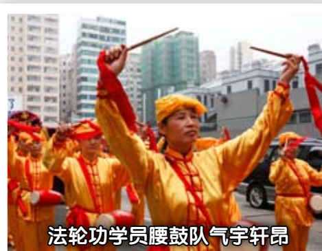
法轮功学员腰鼓队气宇轩昂