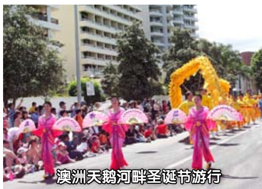
澳洲天鹅河畔圣诞节游行