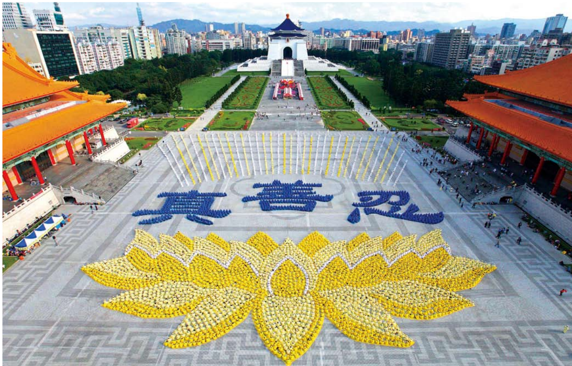
2010年11月27日，五千多名法轮功学员于台湾法轮大法修炼心得交流会召开前夕，齐聚于中正纪念堂广场，举行大型排字活动，排出了优美的莲花座与“真善忍”。