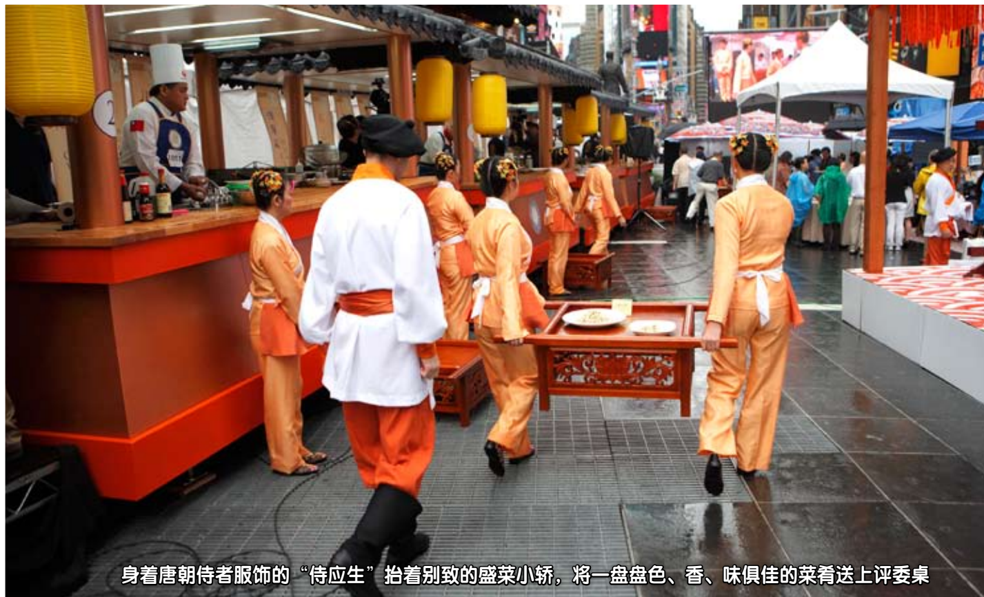
身着唐朝侍者服饰的“侍应生”抬着别致的盛菜小轿，将一盘盘色、香、味俱佳的菜肴送上评委桌

通过两天的比赛角逐，产生了二十三位获奖的大厨，2010年10月3日晚，大赛主办方新唐人电视台在曼哈顿哈德逊河畔的六十号码头，举行了盛大的颁奖典礼。