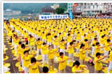
P9 法轮大法弘传全世界