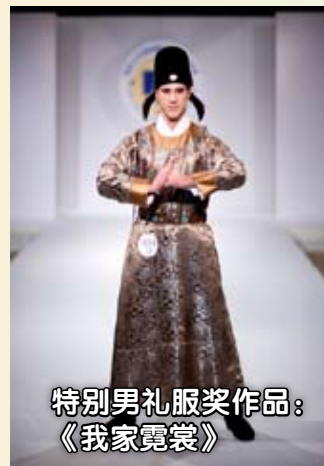
特别男礼服奖作品： 《我家霓裳》