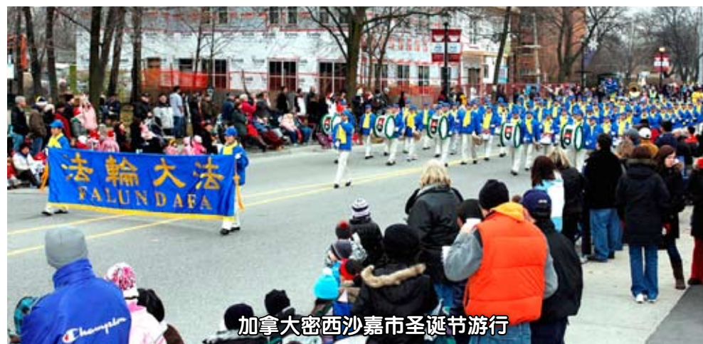
加拿大密西沙嘉市圣诞节游行