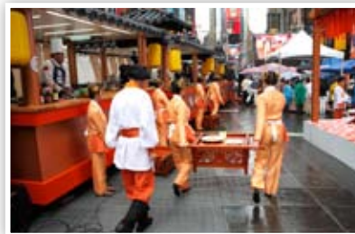
P13 中国菜厨技大赛盛大开锣