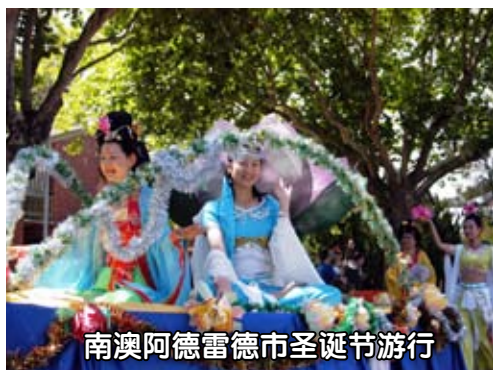
南澳阿德雷德市圣诞节游行