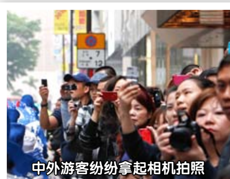
中外游客纷纷拿起相机拍照