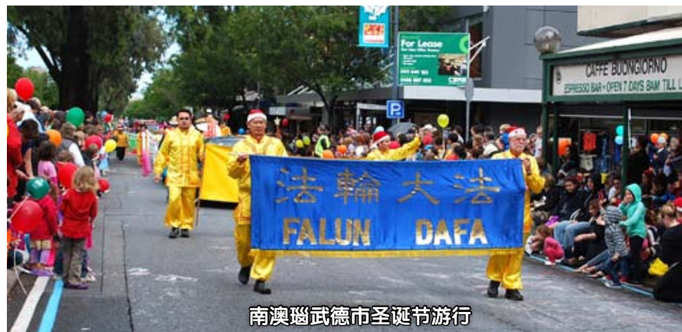
南澳珀斯市圣诞节游行