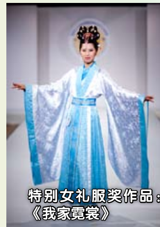
特别女礼服奖作品： 《我家霓裳》