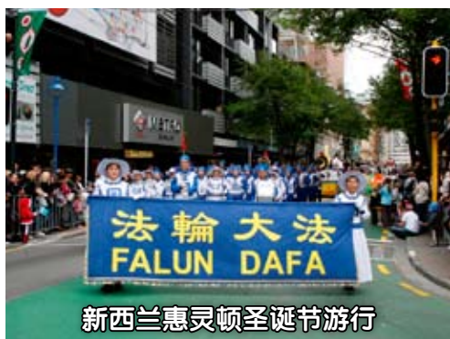
新西兰惠灵顿圣诞节游行