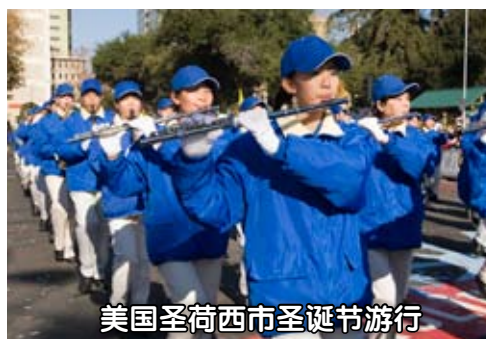
美国圣荷西市圣诞节游行