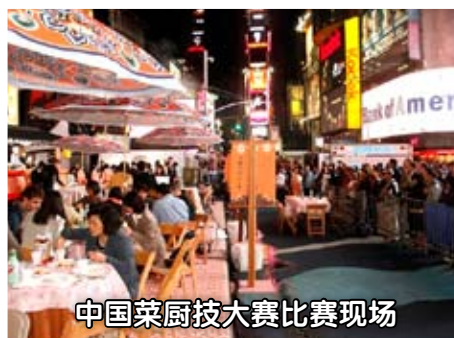
中国菜厨艺大赛比赛现场