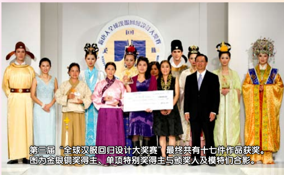
第三届“全球汉服回归设计大奖赛”最终共有十七件作品获奖。 图为金银铜奖得主、单项特别奖得主与颁奖人及模特们合影。

2010年10月16日下午一点，新唐人电视台第三届“全球汉服回归设计大奖赛”的决赛走秀在世界时尚之都的纽约大都会馆正式拉开帷幕。一百五十多套璀璨华美的汉服在纽约大都会馆的舞台上依次登场，令来宾们目不暇接，叹为观止。