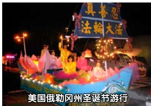
美国俄勒冈州圣诞节游行