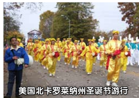
美国北卡罗莱纳州圣诞节游行