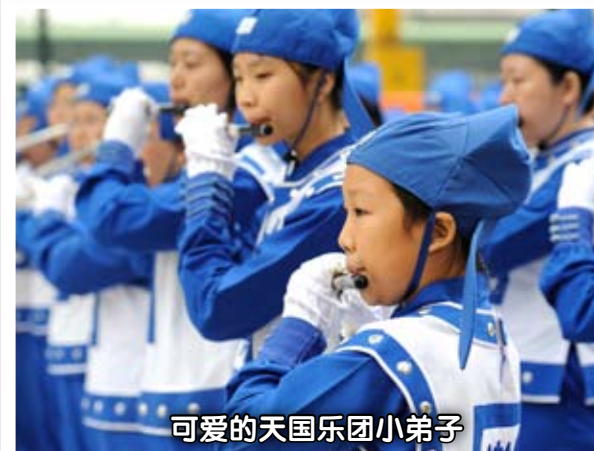
可爱的天国乐团小弟子