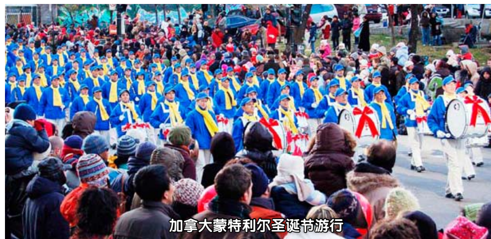
加拿大蒙特利尔圣诞节游行