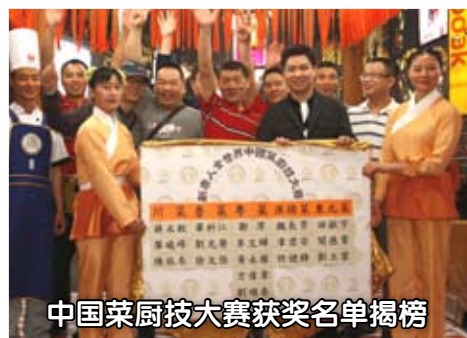
中国菜厨艺大赛获奖名单揭榜