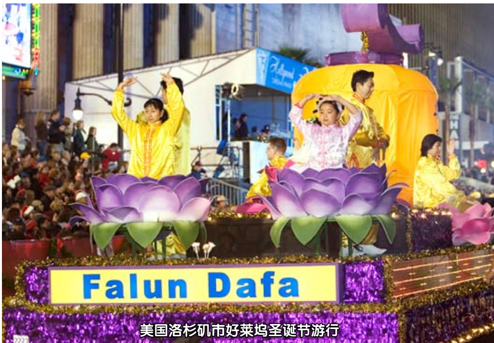
美国洛杉矶市好莱坞圣诞节游行

受邀参加各种重大庆典活动的法轮功学员游行队伍所获得的头等奖、大奖和各类褒奖更是不计其数。在岁末新旧年交替之际，圣诞游行是各地的传统盛事，也是一睹法轮功学员风采的好机会。