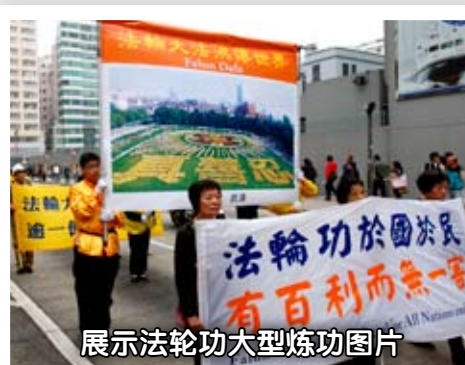
展示法轮功大型炼功图片