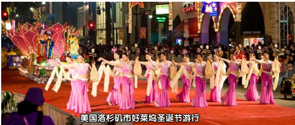
美国洛杉矶市好莱坞圣诞节游行