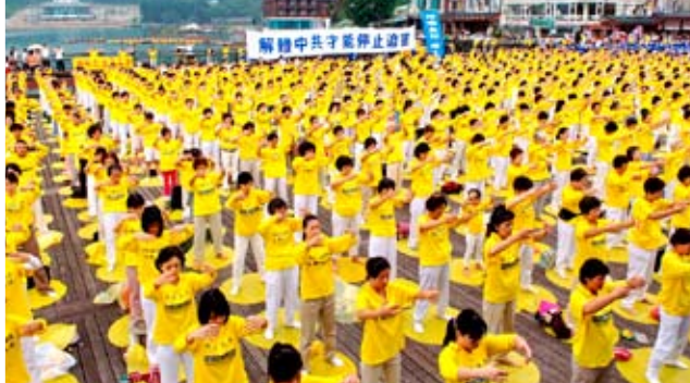
二零零九年七月十八日，近千名台湾中部法轮功学员在名胜景点日月潭集体炼功