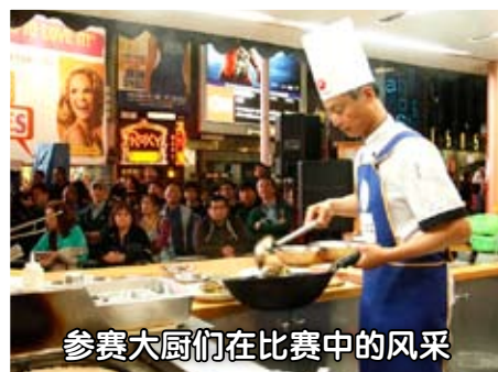
参赛大厨们在比赛中的风采