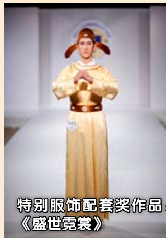
特别服饰配套奖作品： 《盛世霓裳》