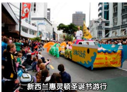
新西兰惠灵顿圣诞节游行