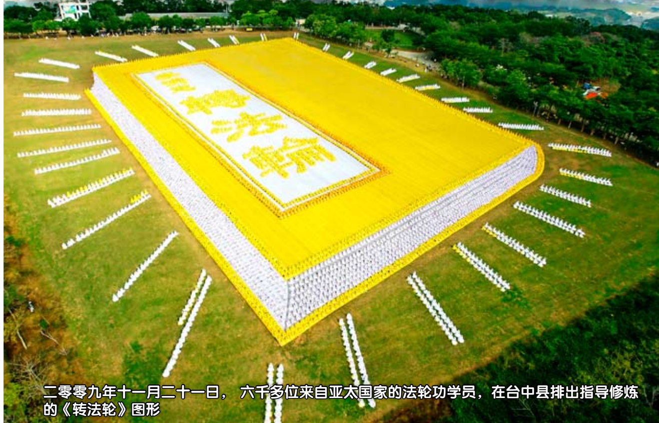
二零零九年十一月二十一日，六千多位来自亚太国家的法轮功学员，在台中县排出指导修炼的《转法轮》图形