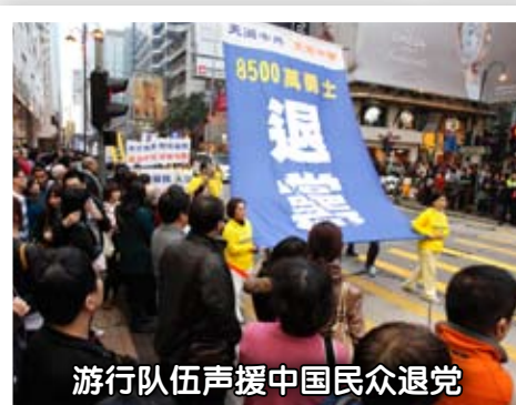
游行队伍声援中国民众退党