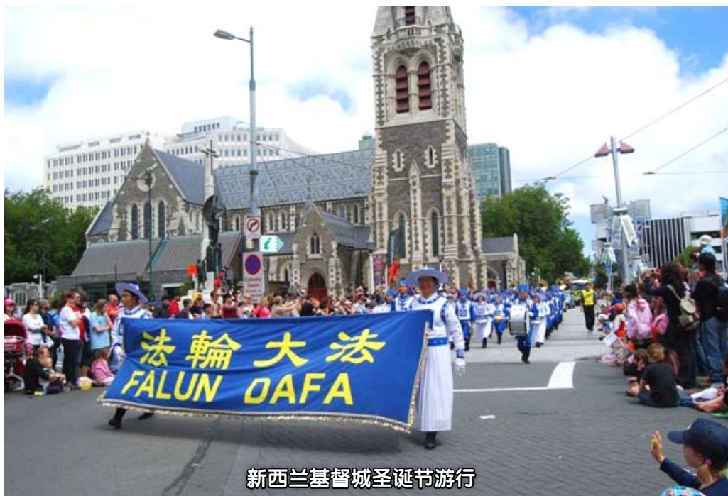
新西兰基督城圣诞节游行