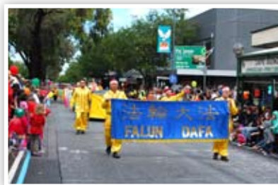
P3 法轮功学员圣诞节游行