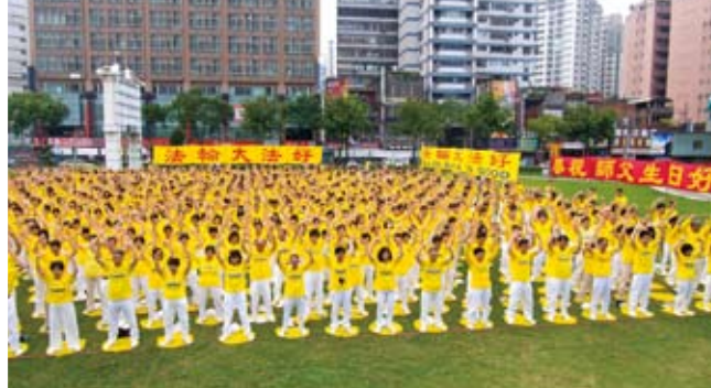
二零一零年五月八日，近千名台湾桃竹苗的法轮功学员在桃园中坜市的中正公园集体炼功