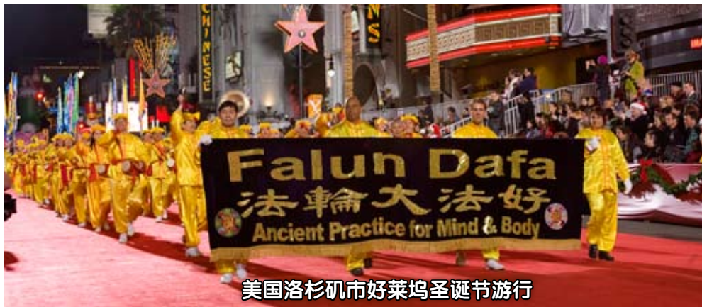
美国洛杉矶市好莱坞圣诞节游行