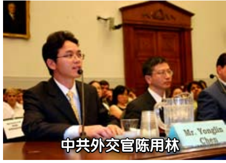
中共外交官陈用林

2005年5月，中国驻澳洲悉尼领事馆负责监控法轮功的外交官陈用林，公开站出来，拒绝继续为中共迫害法轮功卖力并宣布脱离中共，在澳大利亚及整个国际社会引起强烈震撼。