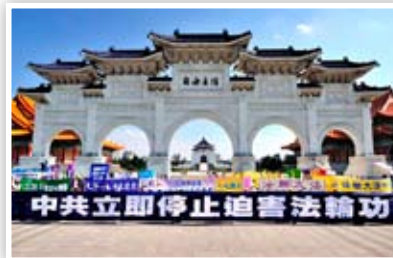
P27 台北法轮功千人集会游行