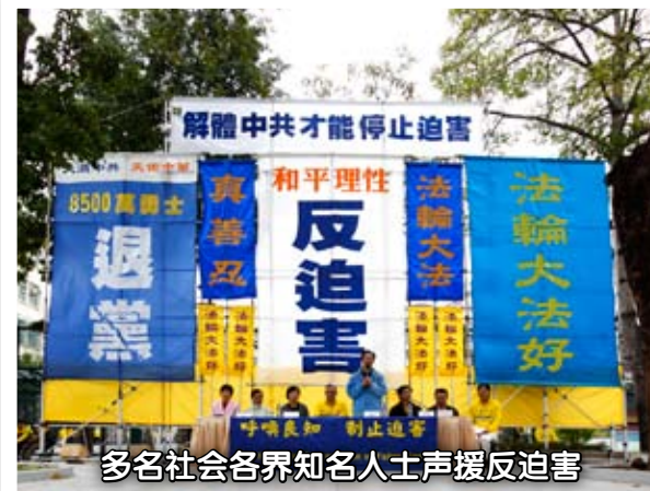
多名社会各界知名人士声援反迫害