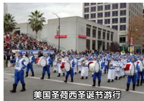
美国圣荷西圣诞节游行