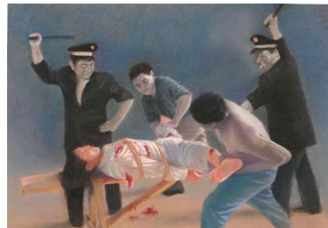
女性法轮功学员遭受的摧残之一： 性侮辱

这些当然不是机密，那是普通公民受到侵犯的事实，理应受到法律的保护。可是中共根本不顾基本的事实，直言不讳地对此定性为“国家机密”。这正说明这场对法轮功的迫害