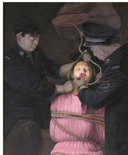
被迫以绝食抗议的法轮功学员被 恶人施以“灌食”酷刑

是完全非法的。由此看来，中共对法轮功的迫害，从上到下能够如此一致地贯穿下来，并能历经十一年而始终维持，全赖中共“国家机密”的保护。中共对法轮功犯下的罪恶在中共国家机密的保护下变得更加罪恶滔天。