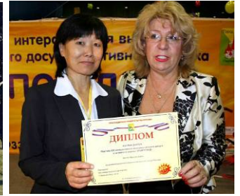
右图：2010年春，俄罗斯“儿童体育王国博览会”组委会颁发两项褒奖给法轮功。