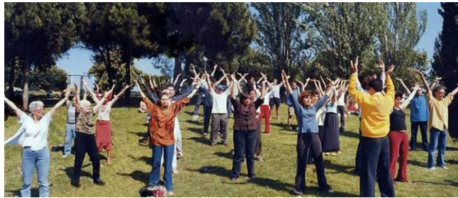
左图：在西班牙全国健康博览会上，一批又一批的参观者在室外学习法轮功。

法轮功已弘传世界一百多个国家和地区，受到各国政府、民众的欢迎和喜爱。令人遗憾和痛心的是，这个美好的功法发源于中国，中国人却被中共强行剥夺了认识他的机会和权利。真心希望所有热爱生命的中国人了解真相，使自己的未来通向美好和光明。（文／云帆）◇