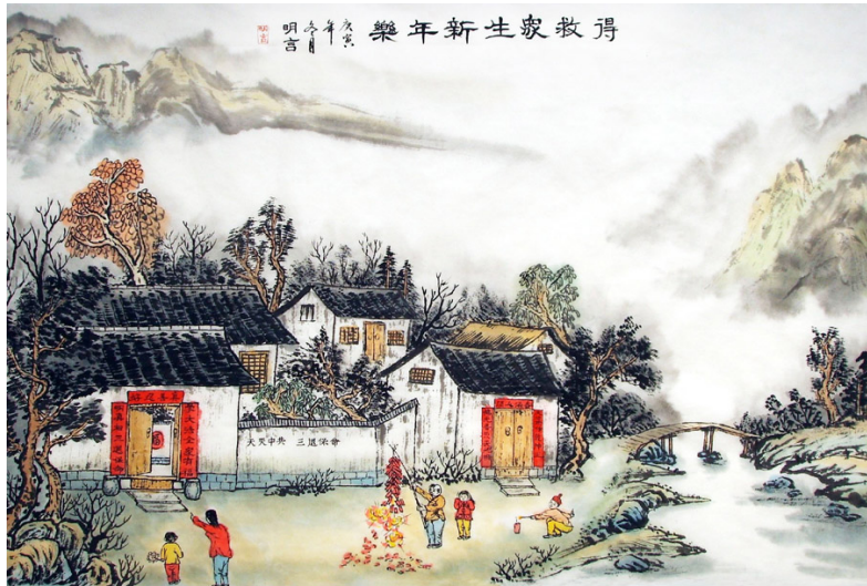
左图 国画「得救众生新年乐」

“不畏浮云遮望眼，自缘身在最高层”，当我们身处高处，静静地思考生命的意义，勇敢面对那真实的一切，不再对这个社会麻木不仁，选择光明，谴责黑暗，那就是为自己的未来负责，对自己的世世代代负责。◇