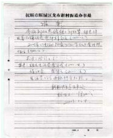
■ 这是 2002 年 1 月 4 日，抚顺市顺城区戈布新村街道办事处勒索钱财的收条