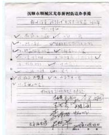
■ 2001 年 12 月 28 日抄家的收条

人员犯罪的铁证。从 2001 年 12 月 28 日抄家的收条看，警察连 2 小袋芝麻都没有放过！