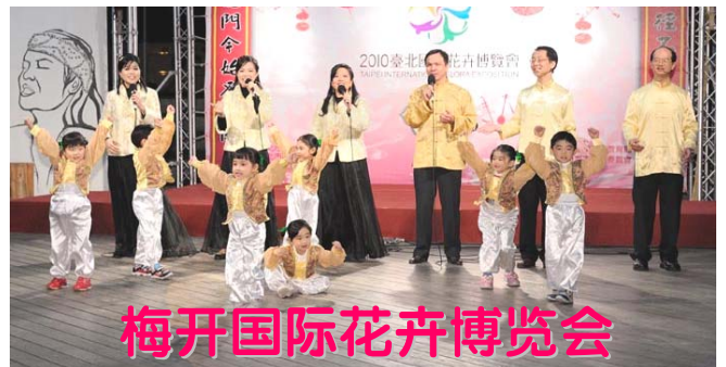
梅开国际花卉博览会

2010 年国际花卉博览会于 11 月 6 日在台北开幕, 展期至 4 月 25 日, 每天吸引数万人参观, 台湾各地民众及大陆游客都慕名而来。