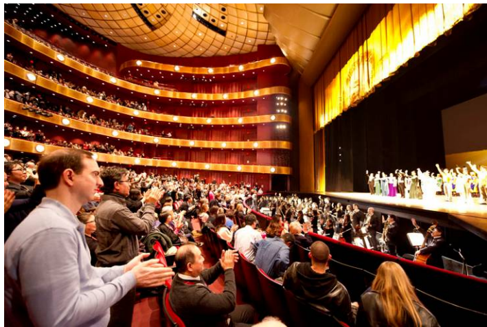
图：2011 年 1 月 16 日下午，神韵纽约艺术团在美国林肯中心大卫寇克剧院的第十场演出落幕。