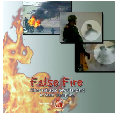
左图：第 51 届哥伦比亚国际电影节获奖纪录片《伪火》

历史总是惊人地相似。两千年后，江泽民集团和中共制造了震惊世界的天安门自焚骗局，煽动仇恨，以便进一步迫害法轮功。国际获奖纪录片《伪火》，对中共的录像做慢镜头分析，人们可以清楚地看到：刘春玲是被现场的便衣击打致死；所谓的自焚男子王进东，浑身衣服被烧得七零八落，可是他两腿