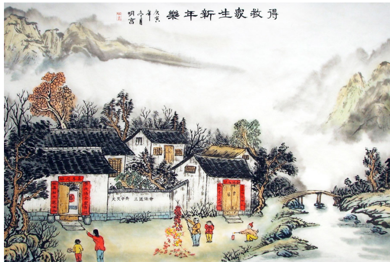
左图 国画『得救众生新年乐』

“不畏浮云遮望眼，自缘身在最高层”，当我们身处高处，静静地思考生命的意义，勇敢面对那真实的一切，不再对这个社会麻木不仁，选择光明，谴责黑暗，那就是为自己的未来负责，对自己的世代负责。◇