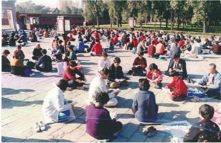
图：1999 年北京法轮功学员们在天坛公园集体学习法轮功主要著作《转法轮》

于取缔法轮大法研究会的决定》和随后公安部依据这个决定而作的“六禁止”《通告》。众所周知，民政部和公安部是两个行政机构，越权发布这样的决定和通告是违宪、违法的，民政部取缔的也只是法轮大法研究会而不是法轮功，更何况这个“组织”早在三年前就已经被中国气功科学研究会正式批准解散，根本就不存在了。