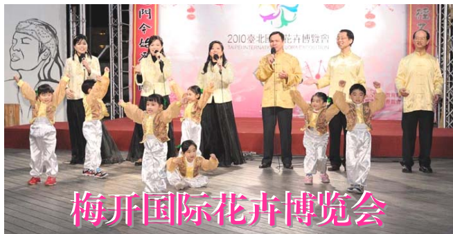
梅开国际花卉博览会

新年祝福 贺年声声爆竹鸣 欢天喜地满门庭 得到真相福音至 自此吉运伴君行 爆竹声中一岁除 新年团圆全家福 送君真相静心看 分清正邪添真福