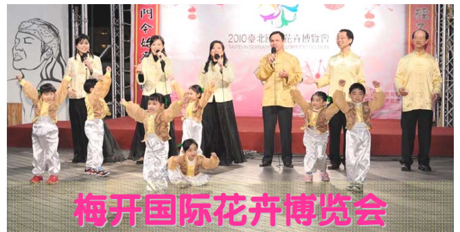
梅开国际花卉博览会

新年祝福 贺年声声爆竹鸣 欢天喜地满门庭 得到真相福音至 自此吉运伴君行 爆竹声中一岁除 新年团圆全家福 送君真相静心看 分清正邪添真福