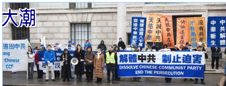
英国退党服务中心在伦敦中国使馆前举行声援三退集会的画面。

由天国乐团引领的游行队伍来到伦敦唐人街，街上的人们立刻被天国乐团的雄壮气势所震撼，也被游行队伍横幅上醒目的中文信息所震动，这些横幅上写着：“天灭中共 天佑中华”、“天灭中共在即 快快退党保命”、“中共解体 中华新生”、“没有共产党才有新中国”。人们纷纷掏出相机和手机留下这历史