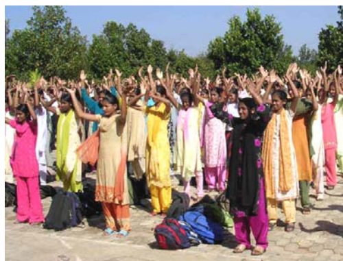
Sri Adichunchanagiri Mahasamsthama moth 学校的学生学炼法轮功

距离班加罗尔市很远的偏僻乡村，有一所叫 Sri Adichunchanagiri Mahasamsthama moth 的宗教学校。这所学校从小学一直到大学，学生超过二千人。法轮功学员来教功法时，长老亲自陪同，各班级老师带着学生，列队学炼法轮功。班加罗尔附近有一所天主教