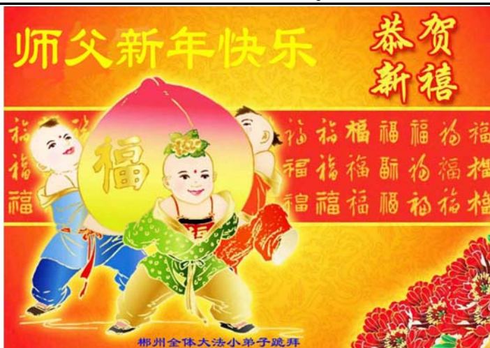
郴州全体大法小弟子恭祝慈悲伟大的师父新年快乐!