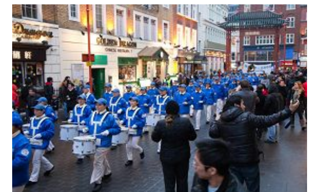
图：天国乐团的演奏吸引了大批民众

退党团队方法 (化名同样有效)：* 用海外邮箱发表声明 tuidang@epochtimes.com * 用破网软件登录 http://tuidang.epochtimes.com * 退党电话：001-416-361-9895 001-888-892-8757 * 退党传真：001-510-372-0176* 无法上网者，可先将声明张贴在公共场所，以后有机会再上网 邮箱： tuidang@epochtimes.com