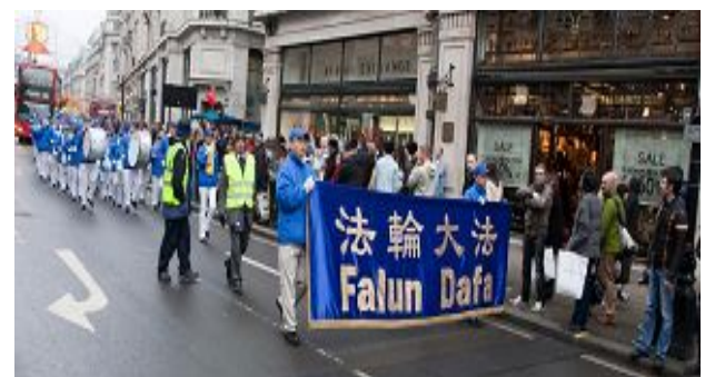
图：天国乐团引领的游行队伍经过伦敦闹市区