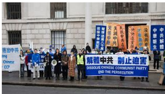
图：伦敦中使馆前举行声援三退集会

由气势雄壮的天国乐团引领的游行队伍来到伦敦唐人街，街上的人们立刻列队两旁观看，他们被天国乐团的雄壮气势所震撼，也被游行队伍横幅上醒目的中文信息所震动，这些横幅上写着：“天灭中共 天佑中华”、“天灭中共在即 快快退党保命”、“中共解体 中华新生”、“没有共产党 才有新中国”。伴着天国乐团演奏的“法轮大法好”乐曲，游行队伍在唐人街绕行两次，与游行队伍在伦敦繁华商业街上遇到的情形一样，唐人街上有很多人面带笑容聚精会神地看着游行队伍，并纷纷掏出相机和手机留下这历史的画面。游行队伍最后来到鸽子广场北部的平台广场上，天国乐团在这个伦敦最著名的公众自由集会场所为广大观众演奏乐曲，霎时间，“法轮大法好”的美妙乐曲响彻在伦敦的中心。每只曲目结束后观众们就热烈地为天国乐团的精彩演奏鼓掌。一个刚从中国大陆武汉市出来读书的留学生难掩自己激动的心情，他告诉记者：“太震撼了！”还有更多的华人面孔的年轻人既高兴又兴奋地观看天国乐团的演出。