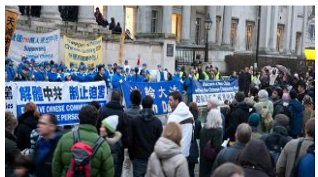
图：天国乐团的演奏吸引了大批民众