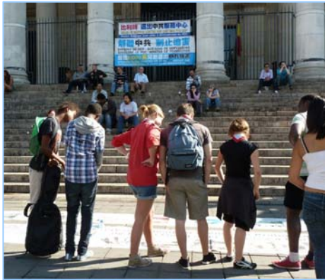
人们在观看揭露迫害的展板

很多中国大陆的游客也索取资料。他们有的来自河南、四川、东北和北京。他们了解到，法轮功的“真善忍”已经传播到一百多个国家和地区，受到各国人民的欢迎和尊敬。◇