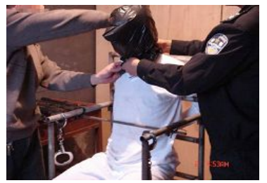
酷刑演示: 用塑料袋套头, 使人窒息