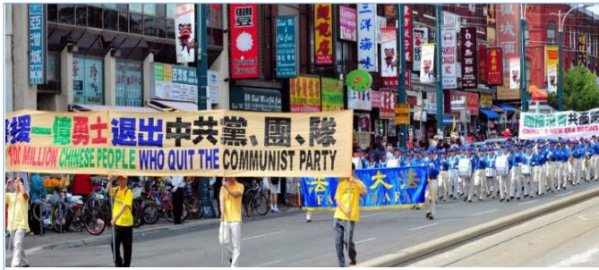
2011년 8월 13일 캐나다 토론토에서 시위집회를 열고서 1억 중국 사람들의 3 퇴를 경축하였다.

중앙군위의 한 사람은 전화를 듣고나서 말하기를 : “내가 당신에게 알려주겠는데 내가 탈당할