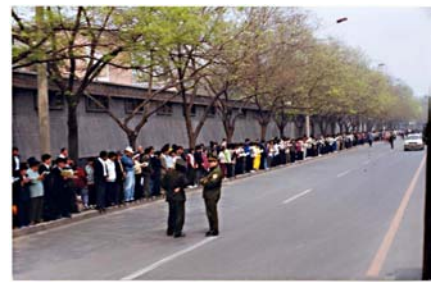
그림 : 1999년 4월 25일 상방현장에서 파룬궁 학원들이 문명하고 안정하여 경찰들은 질서를 유지하지 않았으며 한쪽편에서 한담하였다. 중공이 날조한 이른바 “중남해를 포위공격하였다”는 근본 존재하지 않는다

1999년 4월 25일에 만명의 파룬궁학원이 평화적으로 상방한 일이 발생한 당일 국무원총리의 직접적인 관심하에 합리적으로 천진에서 폭력으로