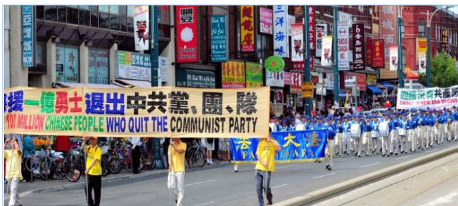
2011년 8월 13일 캐나다 토론토에서 시위집회를 열고서 1억 중국 사람들의 3 퇴를 경축하였다.

중앙군위의 한 사람은 전화를 듣고나서 말하기를 : “내가 당신에게 알려주겠는데 내가 탈당할