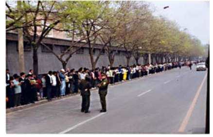
그림 : 1999년 4월 25일 상방현장에서 파룬궁 학원들이 문명하고 안정하여 경찰들은 질서를 유지하지 않았으며 한쪽편에서 한담하였다. 중공이 날조한 이른바 “중남해를 포위공격하였다”는 근본 존재하지 않는다

1999년 4월 25일에 만명의 파룬궁학원이 평화적으로 상방한 일이 발생한 당일 국무원총리의 직접적인 관심하에 합리적으로 천진에서 폭력으로