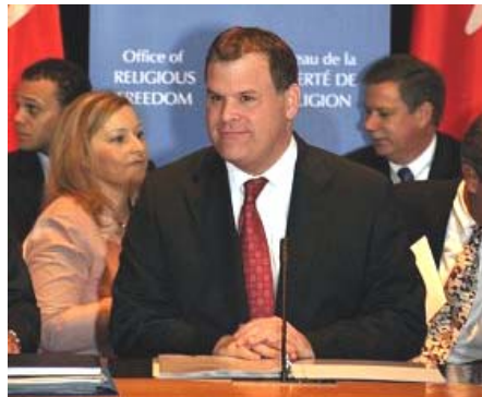
图：加外长约翰·贝尔德就成立“宗教自由办公室”进行了圆桌会议

先生对联邦政府成立宗教自由办公室表示赞赏。李迅说：“在中共持续残酷迫害法轮功和中国人权不断恶化的情况下，加拿大政府坚决支持人权和信仰自由，这对于那些受到中共迫害的人意义重大。我们期待该办公室能对制止中共对信仰的迫害起到进一步推动作用。”