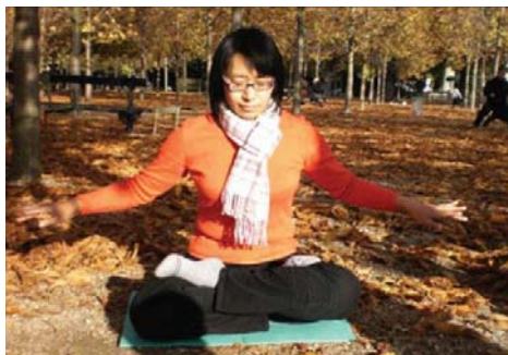
图：作者周末早晨在国家公园炼功

我的病让我对人生极悲观，性格极脆弱。那个时候我就觉得活着没意思。7 岁小学一年级那年，我第一次失学了，是因为白血病，总是住院。