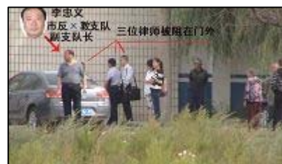
律师被拒法院门外