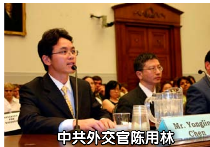
中共外交官陈用林

2005年5月，中国驻澳洲悉尼领事馆负责监控法轮功的外交官陈用林，公开站出来，拒绝为中共迫害法轮功卖力并宣布脱离中共，在澳大利亚及整个国际社会引起强烈震撼。陈用林说，初期，他紧跟中共迫害法轮功，为此他受到良心的谴责。现在他终于脱离中共，走出了恶梦。