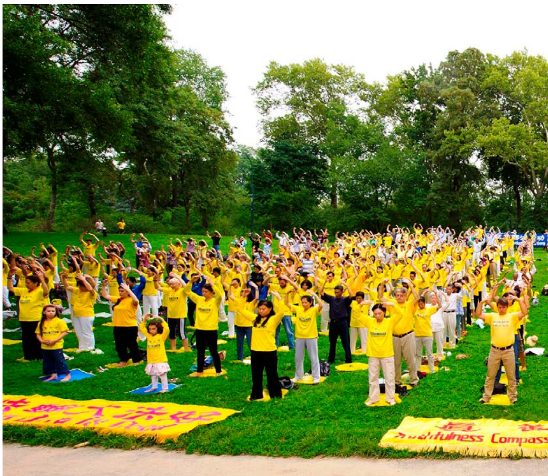
2011年8月27日清晨， 纽约中央公园的草坪上，数百名

2011年8月27日清晨， 纽约中央公园的草坪上，数百名来自世界各地的法轮功学员专注地炼功，场面祥和。