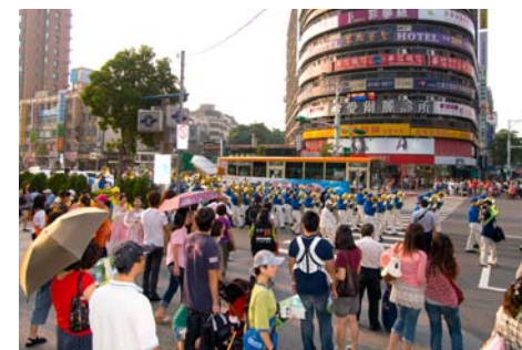
市民观看庆祝“三退”大游行活动

自由广场排楼下，这群来自社会各阶层的正义之师，吸引了往来的中外游客，有些人拿起相机记录下这声势浩大的声援阵容；有些人在“中共残酷暴行”及“法轮功真相”的展板前驻足观看；民视电视台也前来报导。