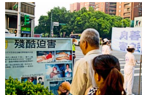
中外游客驻足观看法轮功真相展板