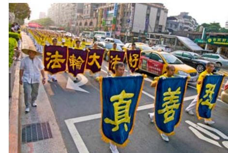
游行队伍行进在台北热闹的商业圈