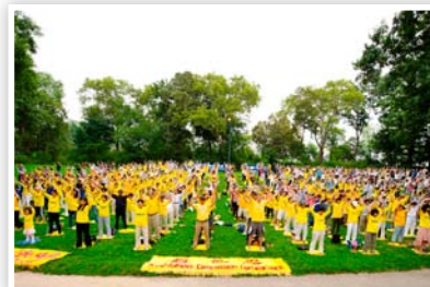
P19 纽约中央公园炼功