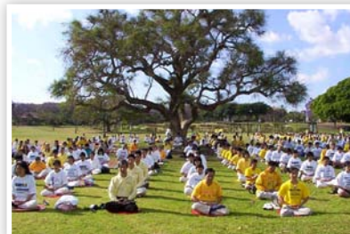
P21 法轮大法弘传全世界