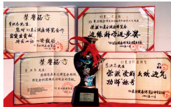
李洪志先生在东方健康博览会获褒奖

事实上，法轮功祛病健身的效果非常显著。1998年，国家体育总局曾组织北京、武汉、大连及广东省的医学界专家，对3万多名法轮功学员做了5次医学调查，表明法轮功祛病健身有效率高于98%，学员心理状况也得到极大改善。同时，以前人大委员长乔石为首的老干部也通过详尽调查，得出“法轮功于国于民有百利而