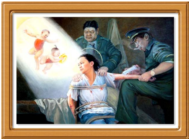
美术作品：《酷刑迫害——打毒针》

了“名誉上搞臭、经济上截断、肉体上消灭”，“打死白打、打死算自杀”，“不查身源、直接火化”的灭绝政策。