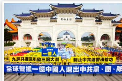
P15 台北大游行 庆一亿人三退