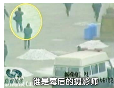
谁是幕后的摄影师

中共称：自焚录像是由安装在天安门广场的监视摄像机拍摄的。但央视录像却有大量近距离及特写镜头，这是监视摄像机做不到的。面对国际社会质疑，中共谎称这些镜头是CNN拍摄的，但CNN发言人驳斥说，他们根本没拍到任何自焚镜头，因为他们的记者在自焚事发前就被中共控制，摄像机被没收。