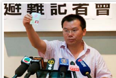
P13 中共罪恶昭彰 各级官员觉醒

然而，1999年7月开始，媒体对法轮功的宣传突然180度大转弯，恶意攻击四起；警察还到公园守着，不让他们去炼功，谁炼就抓谁。这让没有经历过文革的沙米感到非常不可思议、难以理解，同时感到很压