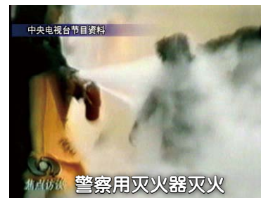
警察用灭火器灭火

从央视录像得知，整个“自焚”从点火到灭火，用了一分多钟。天安门广场上并没有灭火器材，现场显示只有两辆警车，平时也不可能装备大量灭火器材。如果不是事先知情，精心策划，警察怎么可能在一分多钟内迅速拿出十几个灭火器及灭火毯？