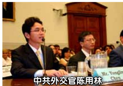
中共外交官陈用林

2005年5月，中国驻澳洲悉尼领事馆负责监控法轮功的外交官陈用林，公开站出来，拒绝为中共迫害法轮功卖力并宣布脱离中共，在澳大利亚及整个国际社会引起强烈震撼。陈用林说，初期，他紧跟中共迫害法轮功，为此他受到良心的谴责。现在他终于脱离中共，走出了恶梦。