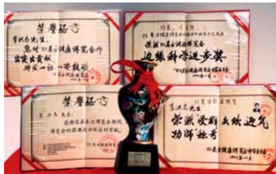
李洪志先生在东方健康博览会获褒奖

事实上，法轮功祛病健身的效果非常显著。1998年，国家体育总局曾组织北京、武汉、大连及广东省的医学界专家，对3万多名法轮功学员做了5次医学调查，表明法轮功祛病健身有效率高于98%，学员心理状况也得到极大改善。同时，以前人大委员长乔石为首的老干部也通过详尽调查，得出“法轮功于国于民有百利而