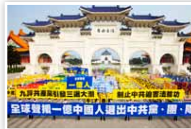
P15 台北大游行 庆一亿人三退