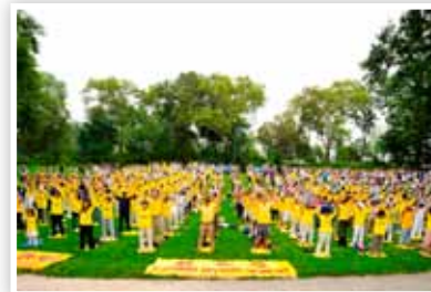
P19 纽约中央公园炼功