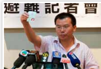
P13 中共罪恶昭彰 各级官员觉醒