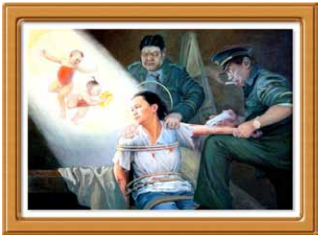
美术作品：《酷刑迫害——打毒针》

了“名誉上搞臭、经济上截断、肉体上消灭”，“打死白打、打死算自杀”，“不查身源、直接火化”的灭绝政策。