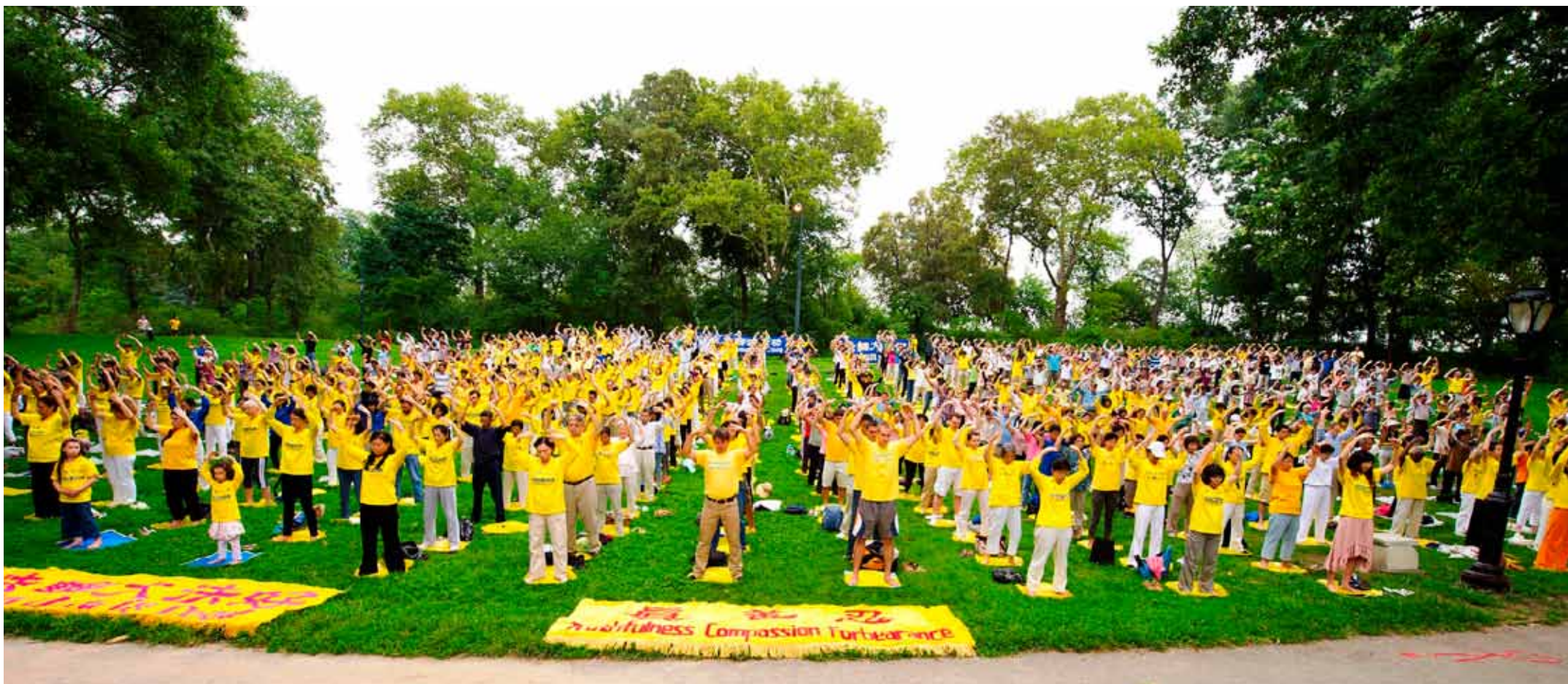
2011年8月27日清晨， 纽约中央公园的草坪上，数百名 来自世界各地的法轮功学员专注地炼功，场面祥和。

2011年8月27日清晨， 纽约中央公园的草坪上，数百名来自世界各地的法轮功学员专注地炼功，场面祥和。