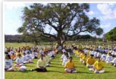
P21 法轮大法弘传全世界