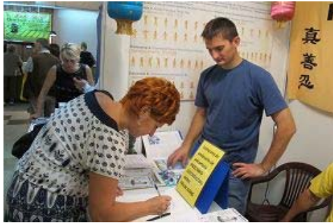
波兰人签名反迫害

轮功学员都是按照法轮功所教导的真善忍做好人的善良公民。他们来自社会各阶层，有工人、农民，也有工程师、医生、教师、科技工作者、商人、公务员等等。修炼法轮功来去自由，法轮功学员可以自由的获取各种资讯。法轮功从来没有强迫任何人改变思想，更没有强行控制任何人的资讯来源。法轮功修炼者都有正常的工作和家庭，只是在日常的生活中按照真善忍做好人，提高心性。法轮功自从一九九二年传出，在中国大陆吸引了难以计数的修炼者，并在海外广为传播。即使中共野蛮迫害，大陆的法轮功学员仍然坚持信仰，足见法轮功的道德感召力。法轮功靠真善忍的理念吸引了众多的修炼者，而中共靠谎言和暴力试图强迫修炼者放弃信仰，谁正谁邪，一目了然。