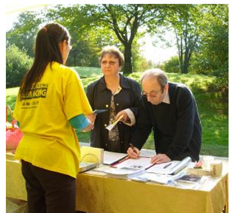
德国人签名反迫害

那么我们怎样做才能拒绝中共邪教呢？一是了解法轮功教人向善的真相，不再被中共的谎言所蒙蔽。再有就是退出曾经加入过的中共党、团、队组织（三退），明确表示不再与中共邪教为伍。目前，已经有超过一亿的中国民众以化名或真名退出中共及其附属组织。退出中共邪教是精神觉醒和自救。相信会有更多的中国人选择退出中共邪教，拒绝中共邪教。相信不久的将来，中共这个邪教必将在大陆解体、消亡。◇