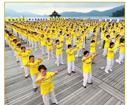
为制止迫害 台湾法轮功学员在日月潭畔集体炼功、讲真相

这样的例子在台湾数不胜数，在世界各地都屡见不鲜，由此可见，中共野蛮的迫害和诽谤，根本无法阻挡法轮功在全世界的弘扬，迄今十二年来，法轮功传遍世界一百多个国家和地区，受到不同族裔各阶层民众的喜爱，法轮功的主要著作《转法轮》被译成三十多种文字在全世界发行。中共的残酷迫害并没有打倒法轮功学员，法轮功更在反迫害中屹立不摇，并蓬勃发展。◇